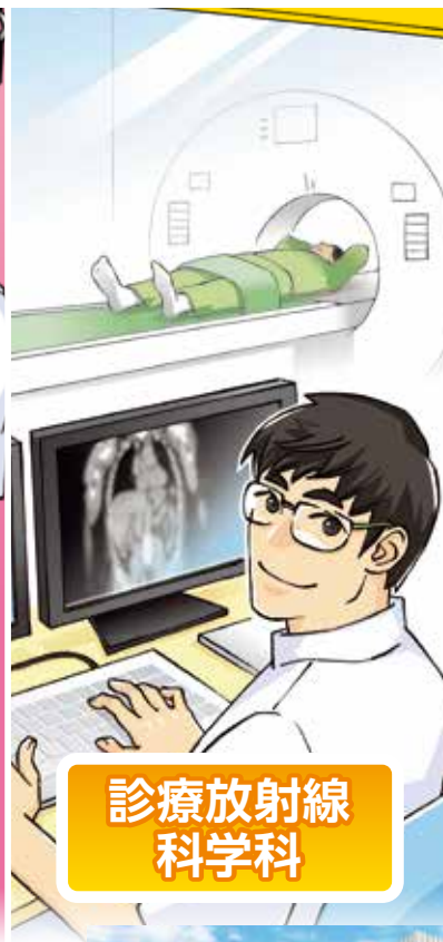
診療放射線 科学科