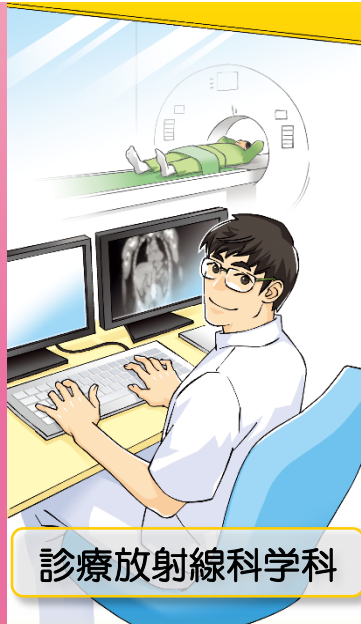
診療放射線科学科